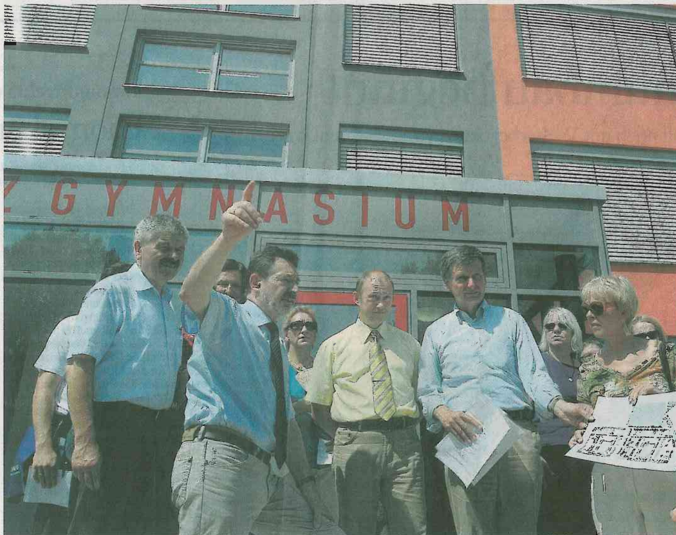
Soziale Stadt-Aufwertungen: Der Campus am Stern mit dem bereits sanierten Leibniz-Gymnasium soll 2011 fertiggestellt sein. Das Projekt ist ebenso durch das Förderprogramm mitfinanziert worden wie der neugestaltete Innenhof im Stadtteil Drewitz (o. r.). Auch Veranstaltungen wie das Lehmbauprojekt „Stadt der Kinder“ werden unterstützt.

Seit zehn Jahren nutzt Potsdam das Geld des Programms „Soziale Stadt“, bei dem die Stadt lediglich ein Drittel der gesamten Investitionssumme bereitstellen muss. Insgesamt wurden 8,5 Millionen Euro im Rahmen des Programms bislang in verschiedene Sanierungsprojekte gesteckt. Zugute kam das auch der Freiflächengestaltung für den Campus am Stern, ein weiteres Vorzeigeprojekt der Stadtverwaltung, das Jakobs bei der Wanderung von Drewitz zum Stern besuchte. 1,8 Millionen Euro flossen von der „Sozialen Stadt“ in die Sanierung und Umgestaltung des Schulstandorts. Insgesamt werden bis 2011 in die „gelungene Aufwertung des Schulstandorts“, so Jakobs, 11,75 Millionen Euro investiert. Entlang der zwei Doppelschulen wurde das Freizeitband mit Spiel- und Sportmöglichkeiten für jedermann gelobt. Die scheidende Baubeigeordnete Elke von Kuick-Frenz